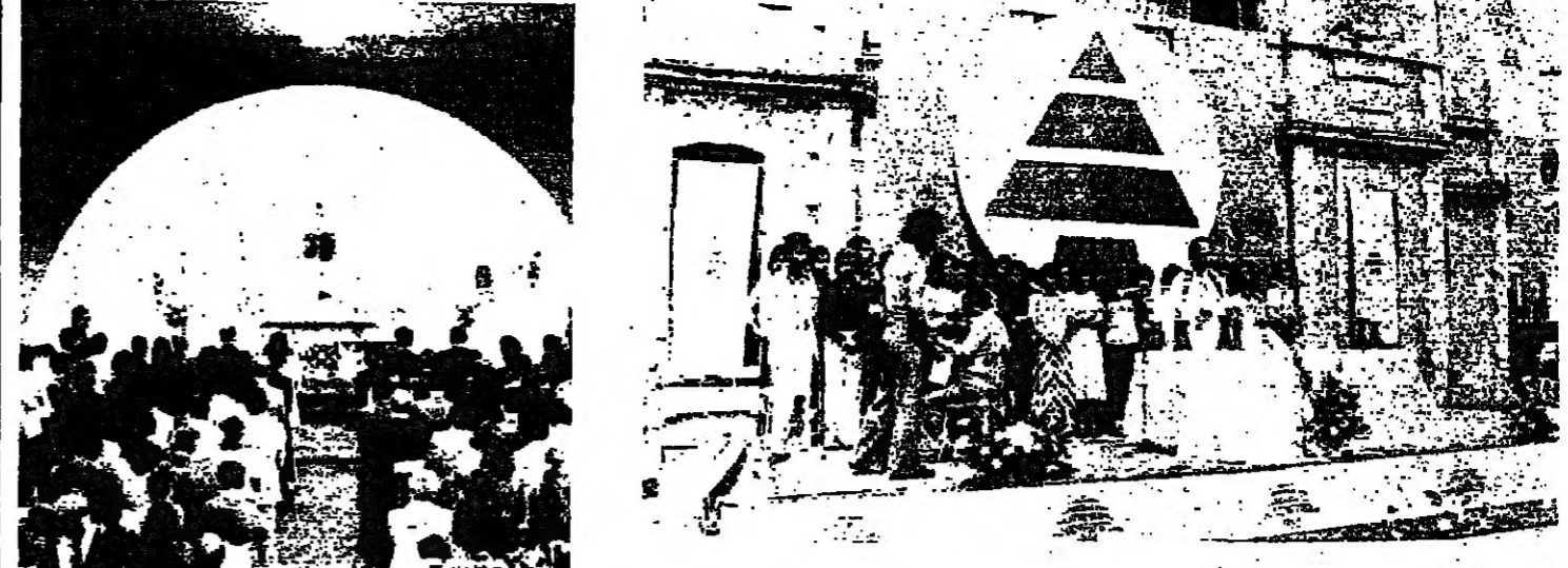
اللجنة في صلحة سراي الجديدة